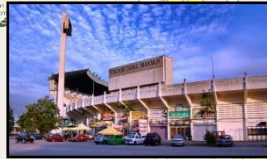
Stadium Darul Makmur Kuantan

No. A-5, Jalan Tun Ismail 2, Sri Dagangan 11, 25000 Kuantan, Pahang Darul Makmur. Tel: 09 - 5659000